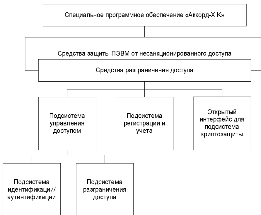
Рисунок 2. Состав СПО «Аккорд-Х К»