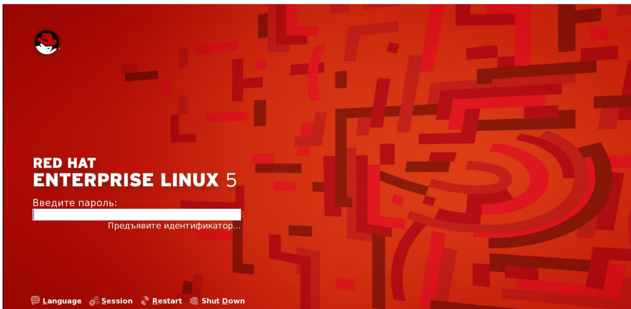
Рисунок 3 – Запрос пароля

После предъявления данных для идентификации (в случае если не произошло ошибки считывания) в появившемся поле «Введите пароль» следует ввести соответствующий пароль пользователя, установленный для него в «Аккорд-Х К» (рисунок Ошибка! Источник ссылки не найден. ).