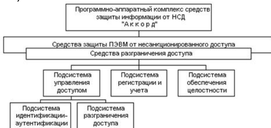
Рисунок 2. Укрупненная схема Комплекса

Комплекс состоит из собственно средств защиты СВТ от НСД и средств разграничения доступа к его ресурсам, которые условно можно представить в виде взаимодействующих между собой подсистем защиты информации (рисунок 2).